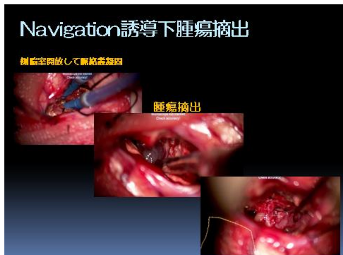
脳腫瘍の術中ナビゲーション誘導下の摘出術